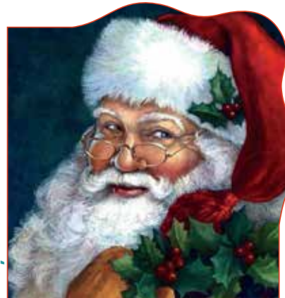
Moș Crăciun la LRF

„Simt că fiecare zi la LRF are un scop. Că, în ansamblu, tot timpul petrecut la școală are un scop. Îmi place mai ales faptul că mă pot implica cu ușurință în proiecte extrașcolare. În curând e Crăciunul și o să am un program mai încărcat, dar o să încerc să mă implic cât de mult pot.” – e gândul de încheiere al lui Moș Crăciun la LRF.